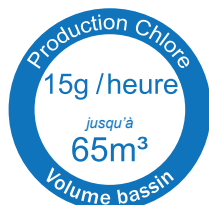
GARO® salt 65