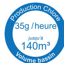
GARO® salt 140