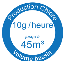
GARO® salt 45