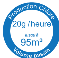
GARO® salt 95